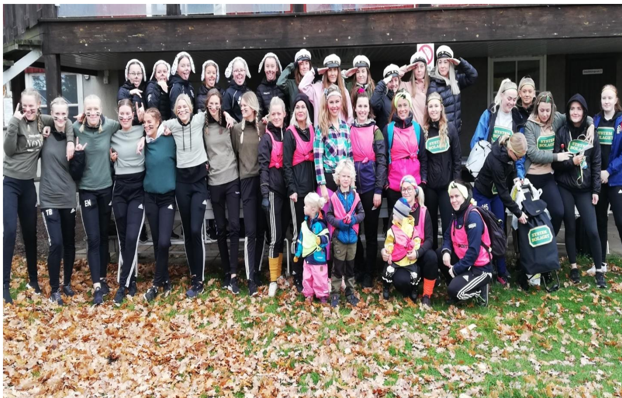
Bild från avslutningen i oktober